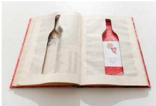
Vila-seca amb DO, llibre objecte Autora: Júlia Porras de Porras