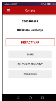
Fig 2. Desactivar el compte d'usuari previ a la desinstal·lació de l'app

En cas d'haver de desinstal·lar l'app, s'hauria de desactivar prèviament el compte d'usuari. Un cop desactivat, tornar a instal·lar l'app i validar-se de nou amb les dades d'usuari. Si es procedeix d'aquesta manera, a l'instal·lar-la de nou no comptabilitza com a nova activació i s'evita el missatge d'avís quan s'arriba al màxim d'activacions permeses.