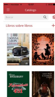
Fig. 2 App Ebiblio